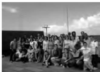
Coro Nacional de Cuba

Espero que siempre pueda volver, pues como dice la canción: MÉXICO, TE LLEVO EN EL CORAZÓN. ”