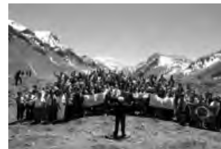
Aconcagua Cima Coral

Cantapueblo se reinventa a sí mismo cada año. Las distintas alternativas que ofreció en esta edición le aportaron una frescura que permitió que el clásico de todos los años se mostrara con un atractivo único.