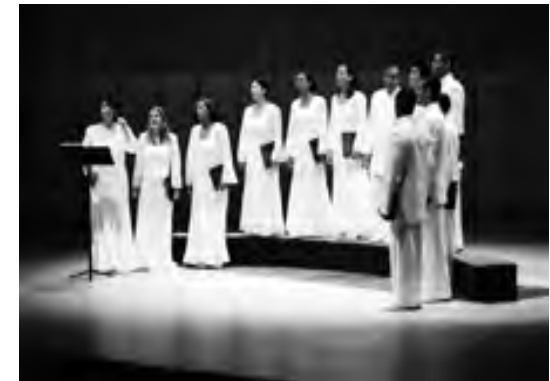
Coro de Cámara EXAUDI.

Me siento profundamente halagada con mi condición de Presidenta Honoraria de Voce in Tempore AC y he colaborado con el movimiento coral mexicano a través de talleres de superación en Dirección Coral, montaje de obras y asesoría en el Diplomado que esta fundación desarrolla en la Ciudad de México y al cual acceden directores de buena parte del país."